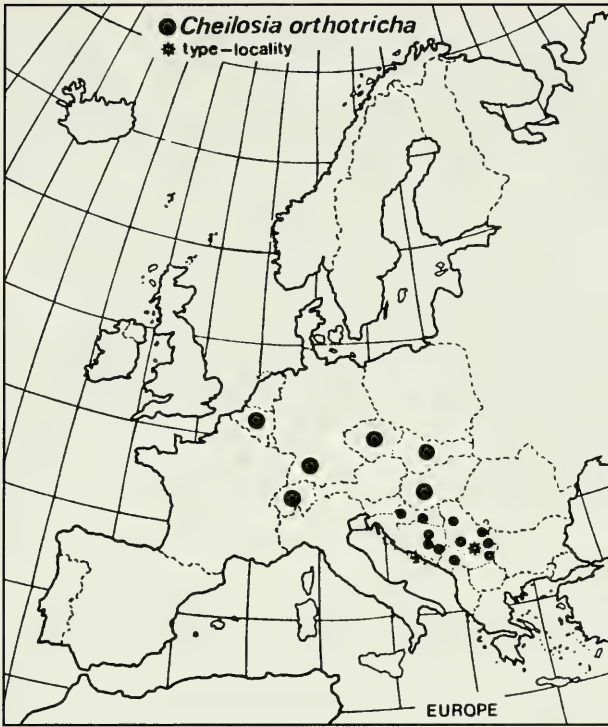
Abb. 3. Verbreitung von Cheilosia orthotricha , spec. nov.